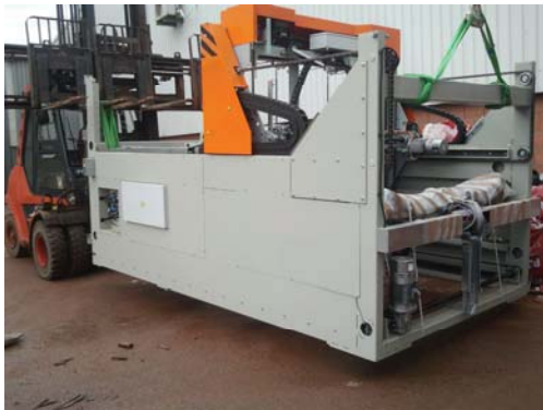
Maschine wird transportiert