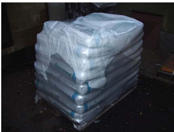
Verpackung vorher (oben) und nachher (unten)