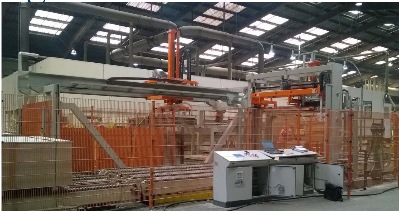
Im Vordergrund die Transportstrecke mit der eigentlichen Umreifungsmaschine. im Hintergrund die Saugtraverse