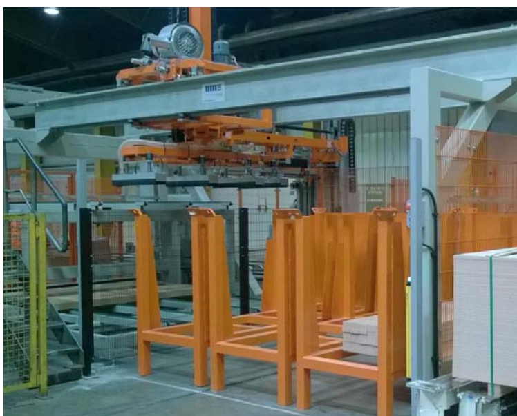
3 Leistenboxen mit der Saugtraverse, die die einzelnen Kantholzlagen auf Vereinzelungsförderplätze positioniert