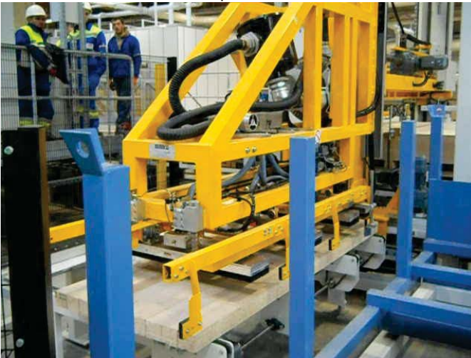
Lagengreifer legt die Lage in Position zum Einschub bei der Umreifung