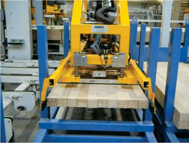
Lagengreifer entnimmt eine Lage Kanthölzer aus den Transportboxen