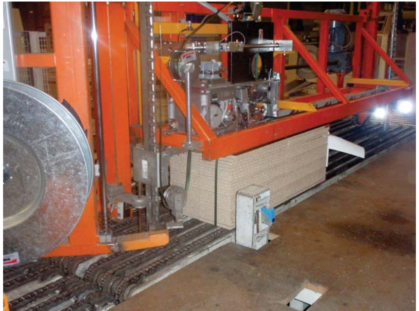
Längsumreifung in Frankreich nach der Umrüstung—neuer Umreifungskopf mit neuer Halterung (gelbe Teile) - Bild oben und unten