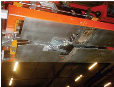
Andrückplatte wurde modifiziert