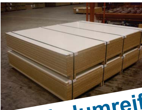
Verpacktes Produkt— Kantholz unten + Winkel oben