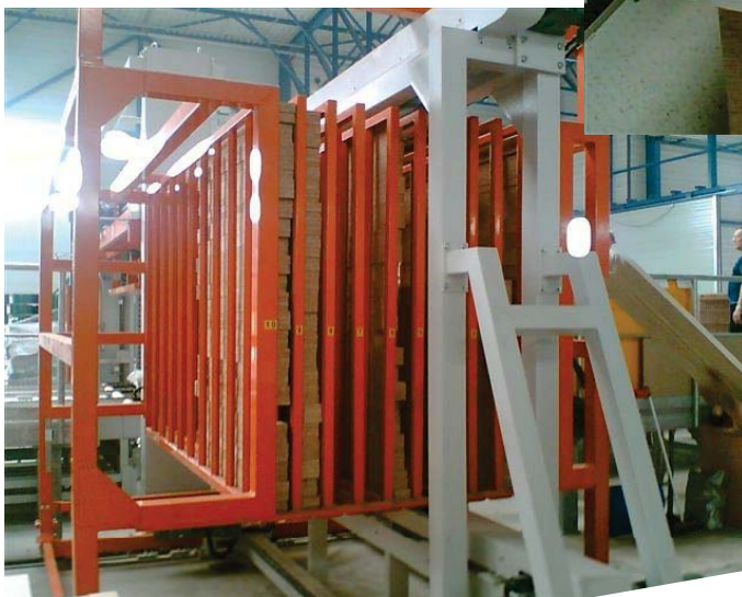
Kantholzmagazin, ver- fahrbar

Vertikalumreifungen, Lettland josef.riegler@riegler-verpackungstechnik.com www.riegler-verpackungstechnik.com