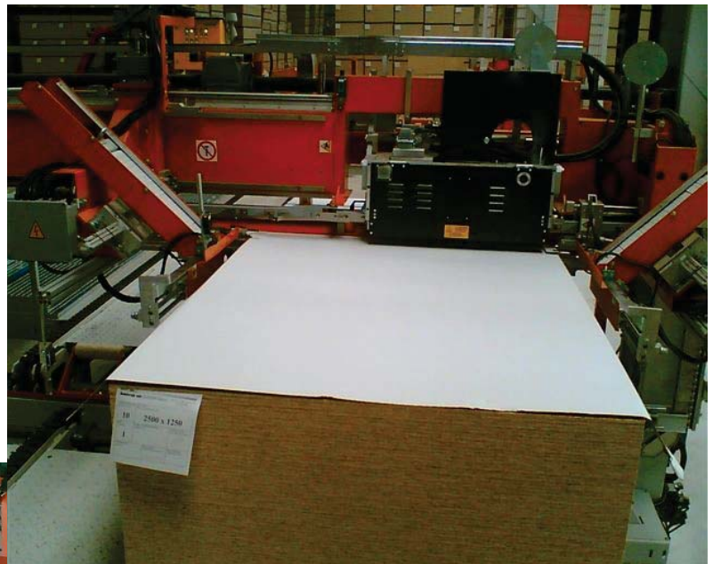
Maschine 1 (in Transportrichtung)