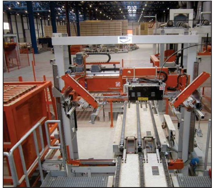
Umreifungsmaschine mit Winkelanleger