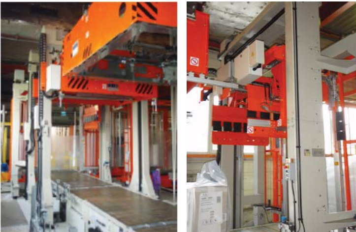
(L) Haubenüberzieher+Deckblattaufleger (R) Einschlagm.