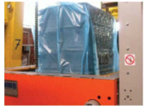
Haube wird übergezogen.. ..und dann geschrumpt