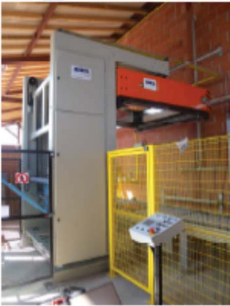
Haubenschrumper mit Bedienpanel