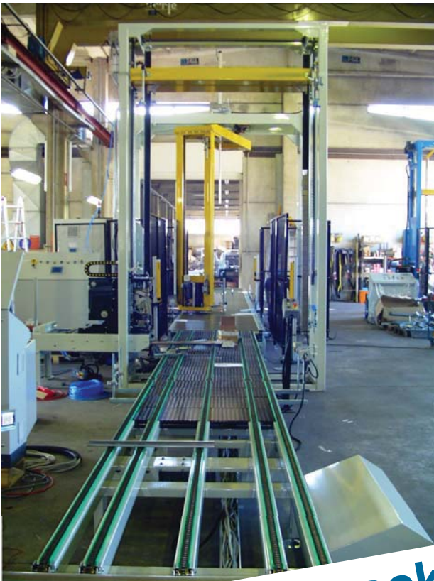
Seitenverschlussumreifung vor Wickler