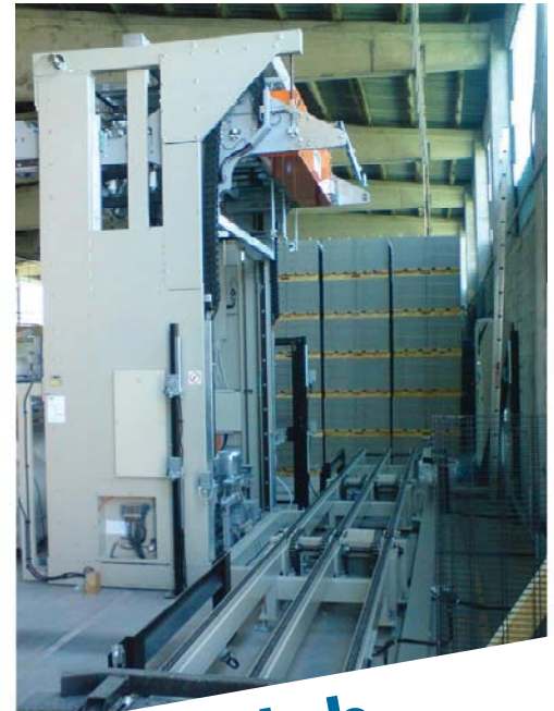
Maschine mit Förderer