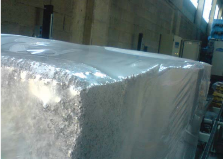
Extrem scharfkantige Steine werden mühelos verpackt