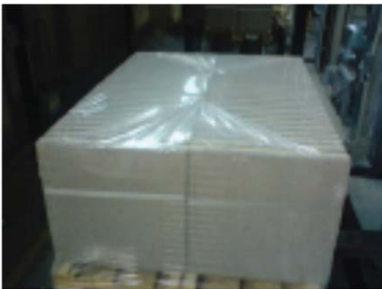
Viele verschiedene Produkte (Pflastersteine, Hohlblocksteine, Platten etc.)