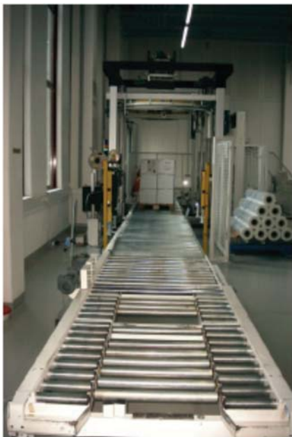
Abnahmebereich mit Drehringwickler