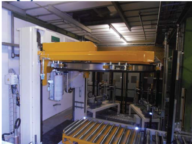
Ringwickler mit Winkelanleger