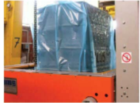
Haube wird übergezogen.. ..und dann geschrumpft