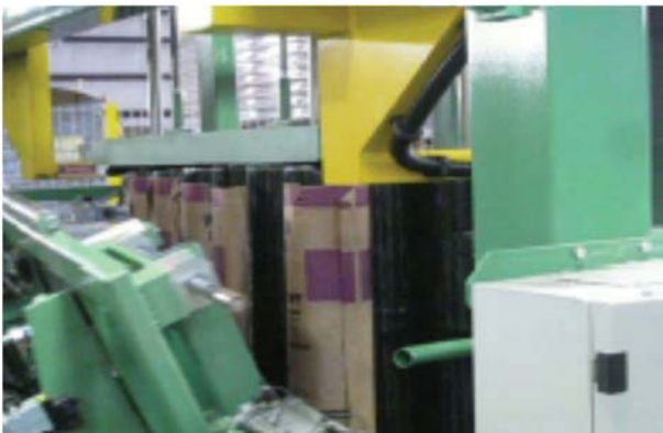
Paket wird fertiggestellt (oben).. ..2-teiliger Umreifungskopf macht die Umreifung (unten)