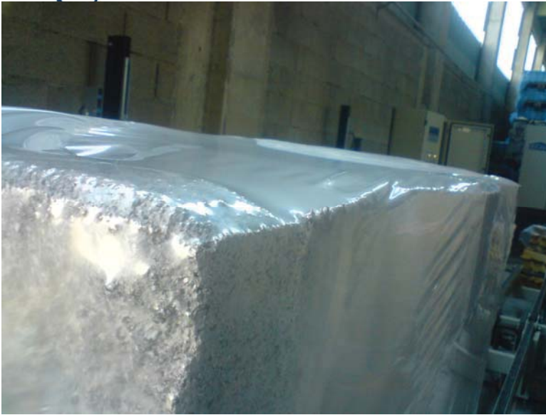
Extrem scharfkantige Steine werden mühelos verpackt