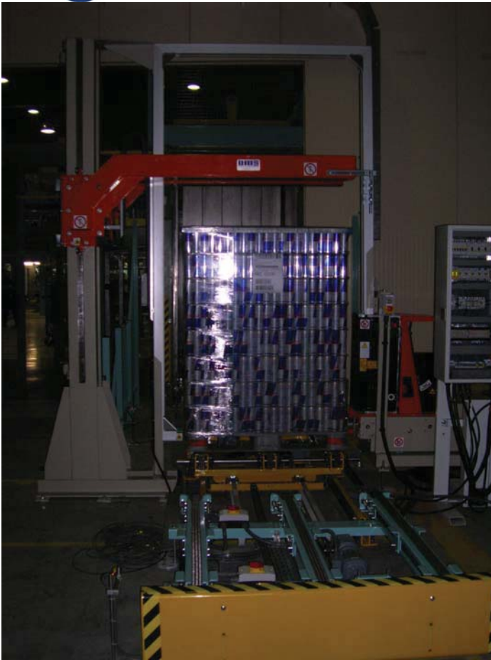
Maschine mit Paket