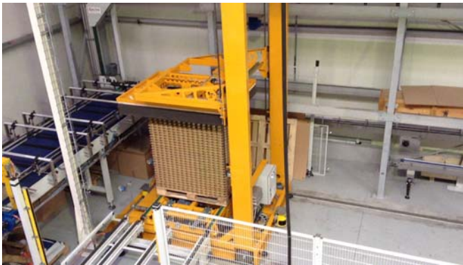
Übernahme auf Shuttle 1 von Palettierer 1