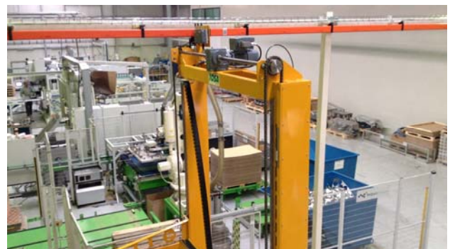
Stomabnahme der Shuttles auf 4m Höhe