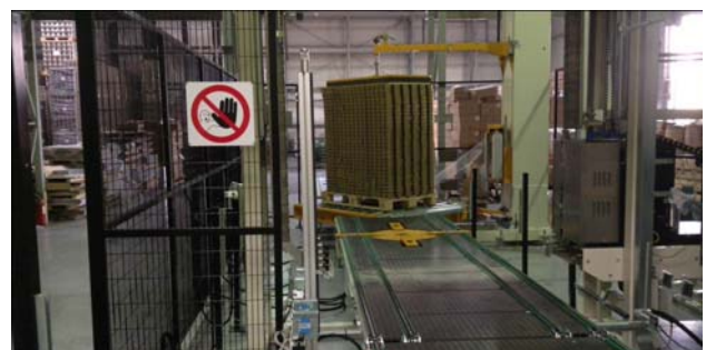
Umreifung, Drehkreuz und Wickler

HR-Dosenverpackungslinie komplett josef.riegler@riegler-verpackungstechnik.com www.riegler-verpackungstechnik.com