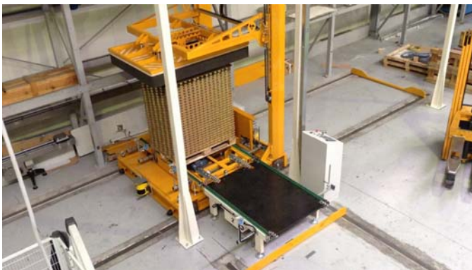
Übergabe von Shuttle 1 auf Zwischenstation