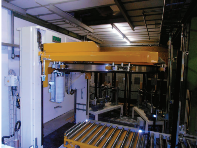
Ringwickler mit Winkelanleger