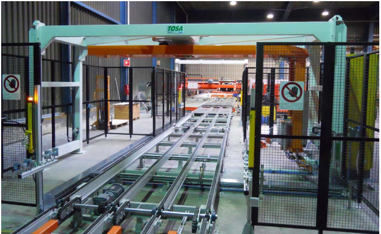
automatischer Dreharmwickler für Großpakete