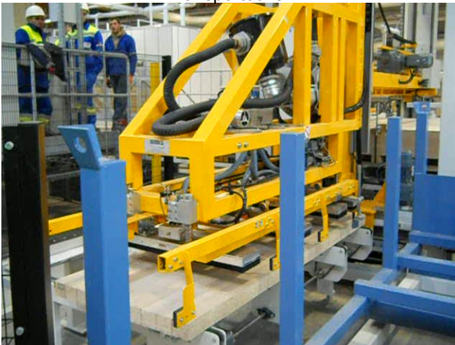
Lagengreifer legt die Lage in Position zum Einschub bei der Umreifung