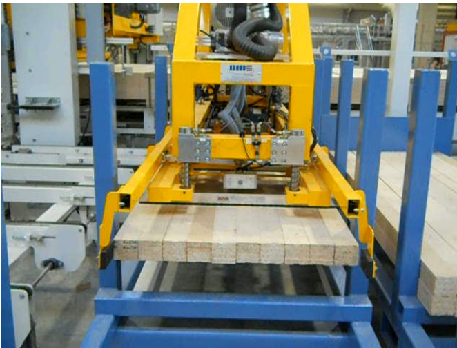
Lagengreifer entnimmt eine Lage Kanthölzer aus den Transportboxen