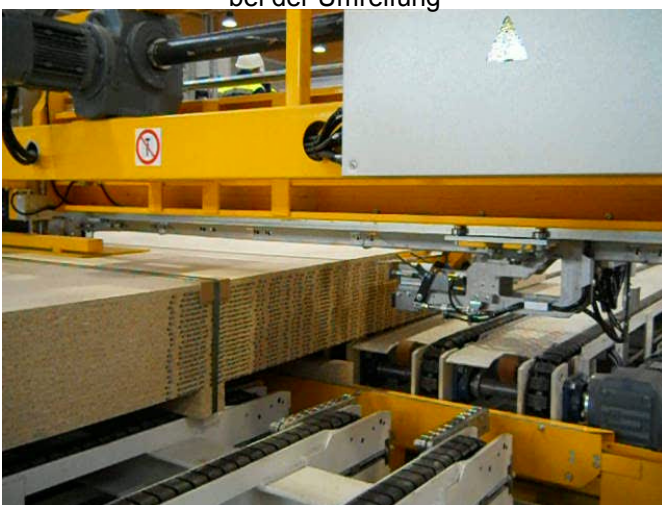
Eingeschobenes Kantholz vor Umreifung