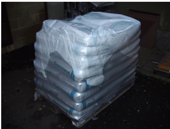
Verpackung vorher (oben) und nachher (unten)