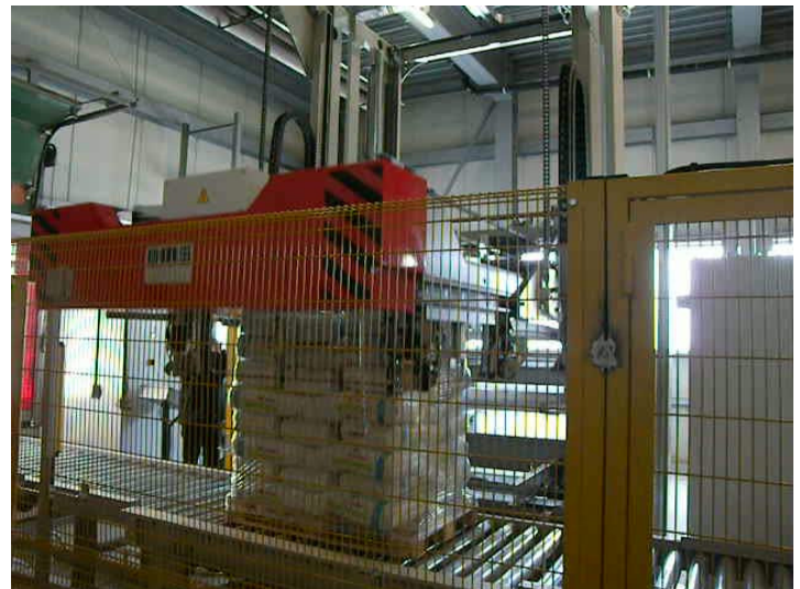
Maschine beim Überziehen der Haube