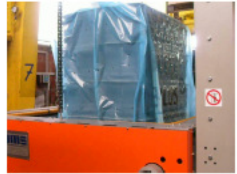
Haube wird übergezogen.. ..und dann geschrumpft