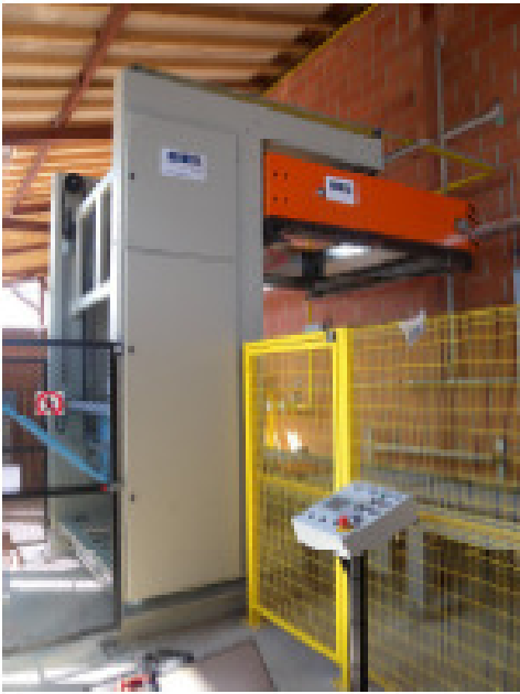
Haubenschumpfer mit Bedienpanel