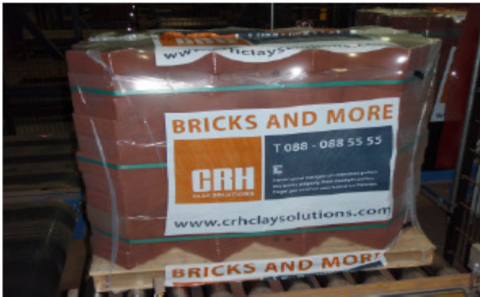
fertig verpacktes Produkt