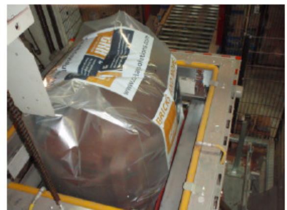
Beginn des Schrupfvorgangs