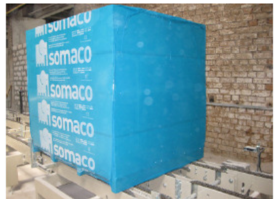
Fertig verpacktes Produkt

Maschinen: Palettenmagazin Horizontalumreifung Haubenüberzieher Schrumpfmaschine Transport: Rollenbahnen mit Paketvereinzlung Eckumsetzer auf Kettenbahnen Gesamtlänge der Transportstrecke 42m Umsetzung: 2009