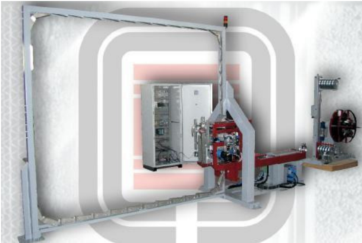
Stapelumreifung als Seitenverschluss