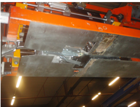
Andrückplatte wurde modifiziert