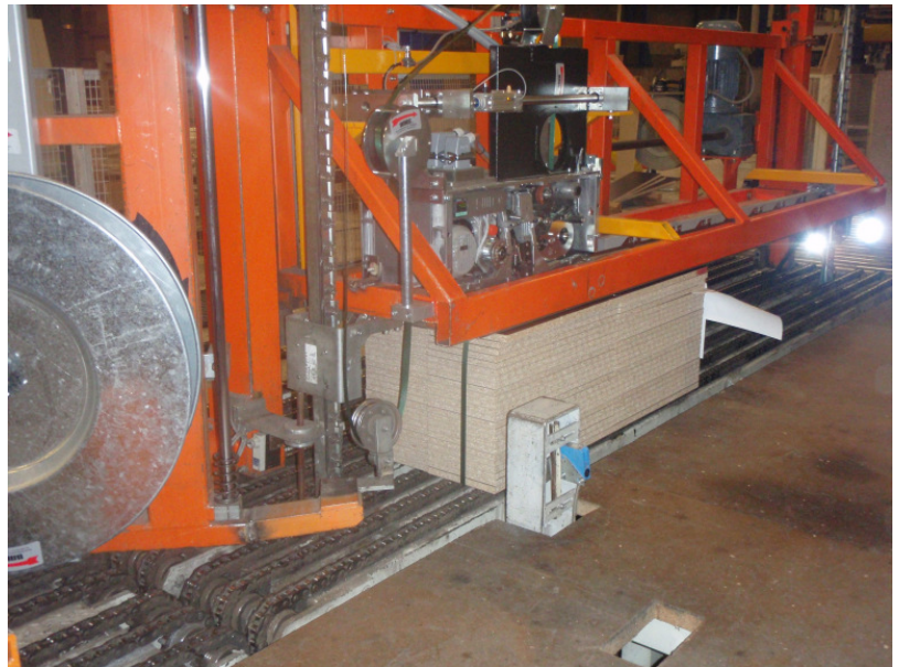
Längsumreifung in Frankreich nach der Umrüstung—neuer Umreifungskopf mit neuer Halterung (gelbe Teile) - Bild oben und unten

Maschinen: Retrofit mit OMS TR-Köpfen, mit angepassten Halterungen Umsetzung: 2008, 2009, 2011