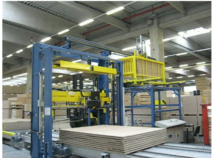
Komplettansicht der Maschine mit Leistenmagazin

Maschinen: 08/TR19HT mit Leisteneinschub und Magazin oben Umsetzung: 2009