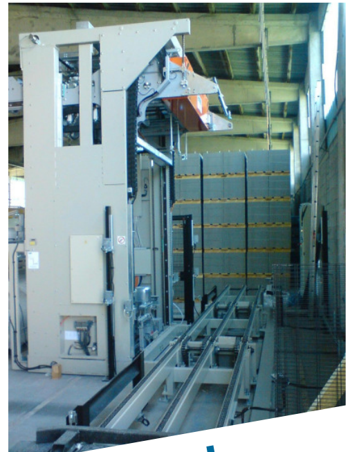
Maschine mit Förderer