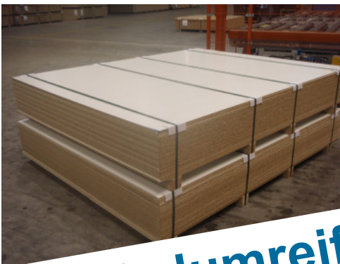
Verpacktes Produkt— Kantholz unten + Winkel oben