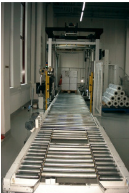
Abnahmebereich mit Drehringwickler

Verpackung: Vertikalumreifung Ringwickler Förderstrecke als stand-alone-line Transport: Rollenbahnen mit Aufgabe- und Abnahmestationen mit Einfahrschlitzen Umsetzung: 2 Linien, 2006 und 2008