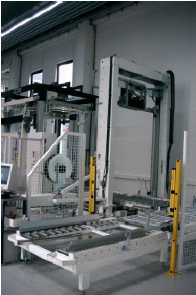
Aufgabebereich mit Vertikalumreifung