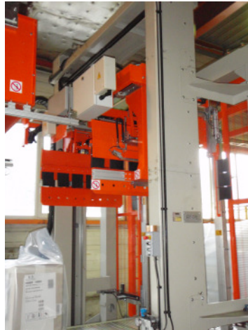
(L) Haubenüberzieher+Deckblattaufleger (R) Einschlagm.