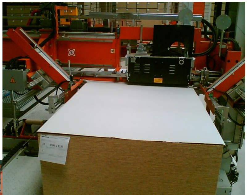
Maschine 1 (in Transportrichtung)