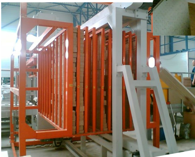
Kantholzmagazin, ver- fahrbar