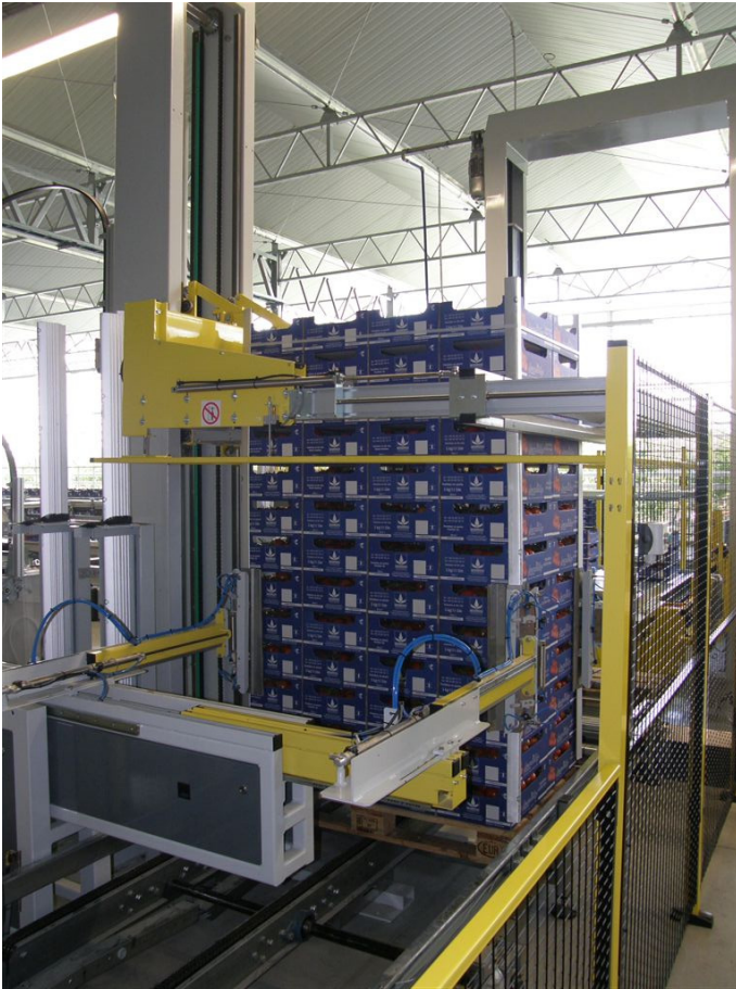
Umreifung mit Winkelanleger